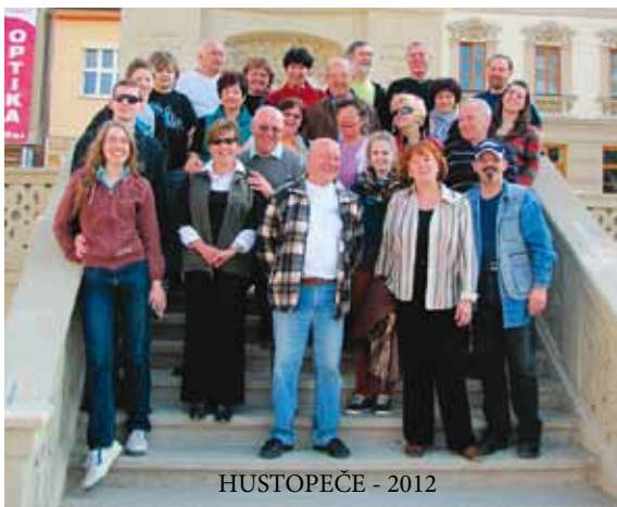
HUSTOPEČE - 2012