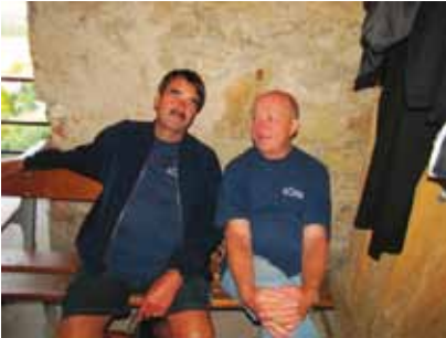
štace jako řemen