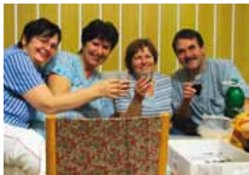
ZÁBŘEH na Moravě