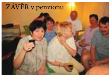
ZÁVĚR v penzionu